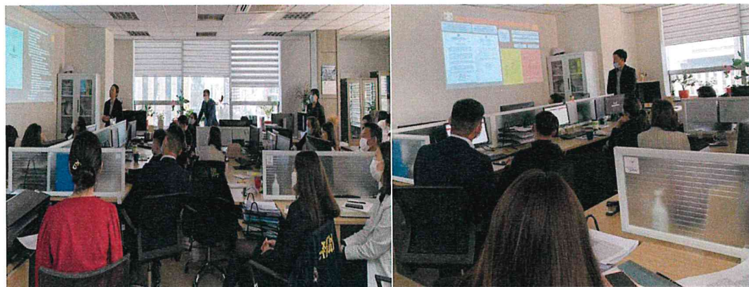
/Ажлын байран дахь сургалт-4, Төрийн албаны тусгай шалгалт өгөх 15 албан хаагчид шалгалтад бүртгүүлэхэд анхаарах зүйлс, баримт бичгийн бүрдлийг хэрхэн бүрэн хангуулах талаар, 2022.06.22-ны өдөр/