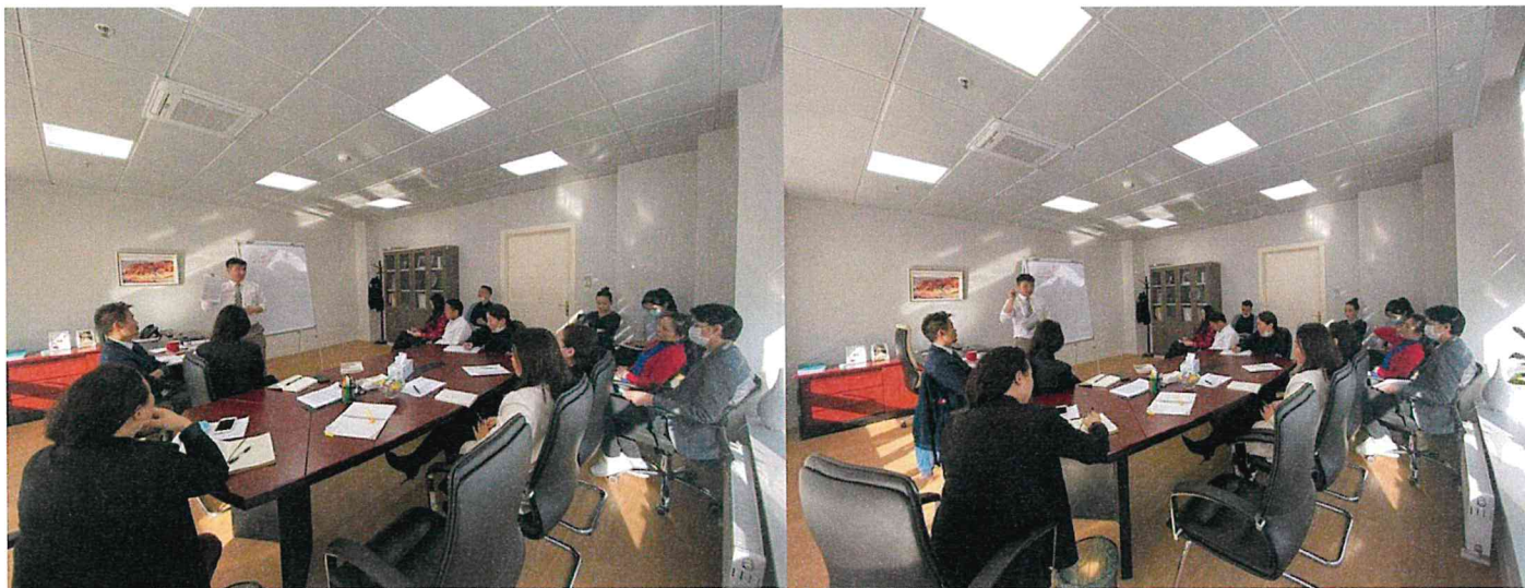
/Ажлын байран дахь сургалт-2, Гэр бүлийн харилцаа, эцэг эхийн зөвлөлийн үүрэг, оролцоо, 2022.05.29-ний өдөр/